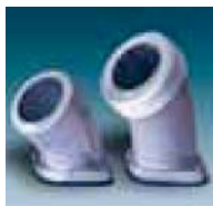
Descarga (manguera, BSP, NPT)