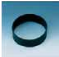
Collarín de baja aspiración