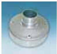
Acoplamiento en serie

Las bombas WEDA 30/40 tienen un retén mecánico en aceite. Ligeras y duraderas.