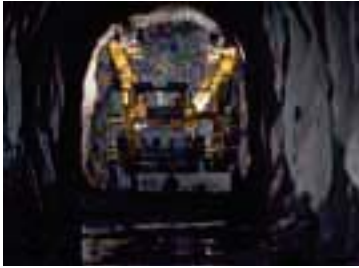
Minería y excavación de túneles