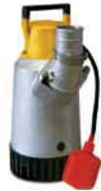
Interruptor de flotador