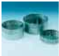
Tamices de acero inoxidable

Los modelos WEDA 10 incorporan una solución de sellado rentable.